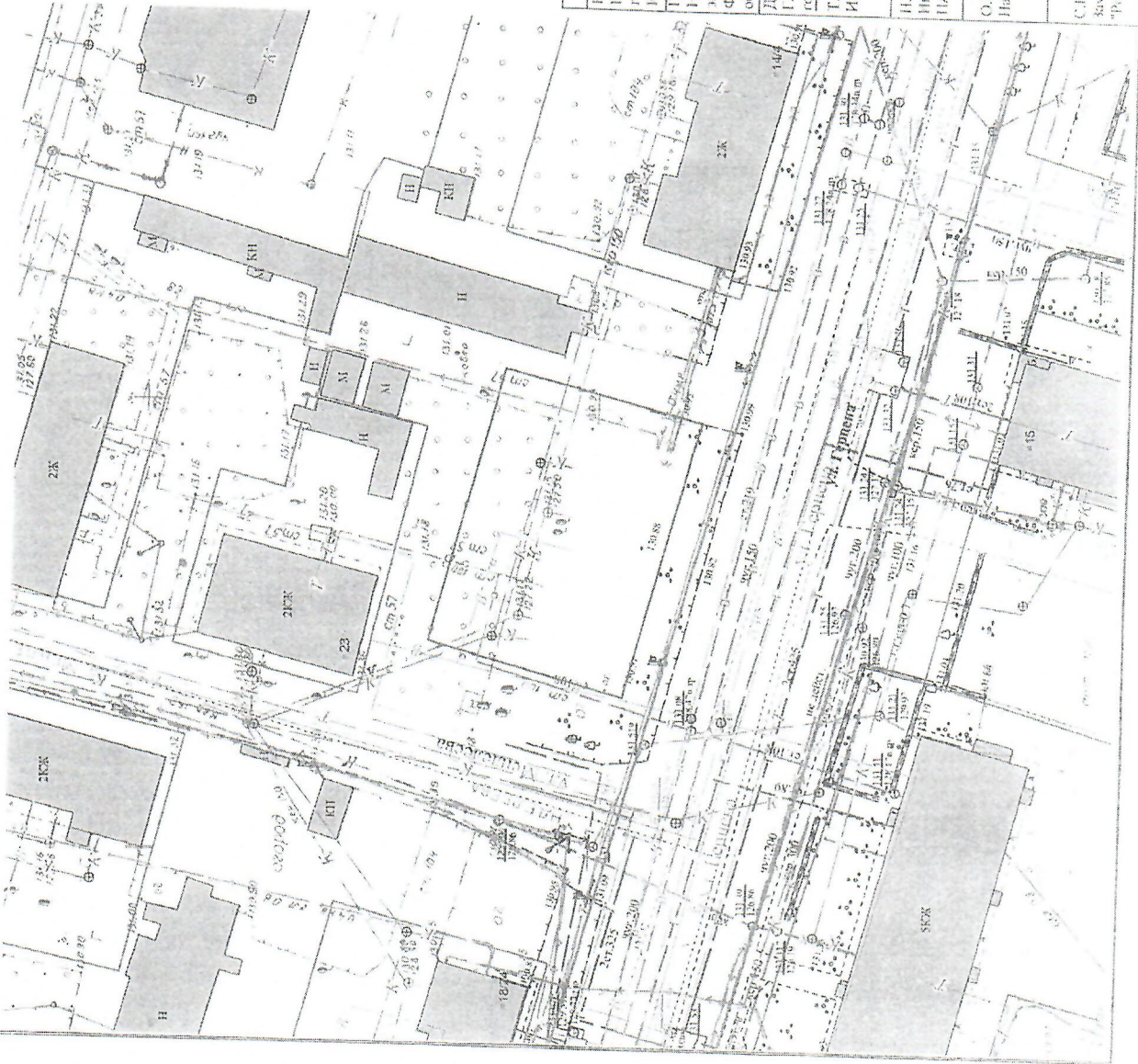
СИТУАЦИОННЫЙ ПЛАН М 1:2000