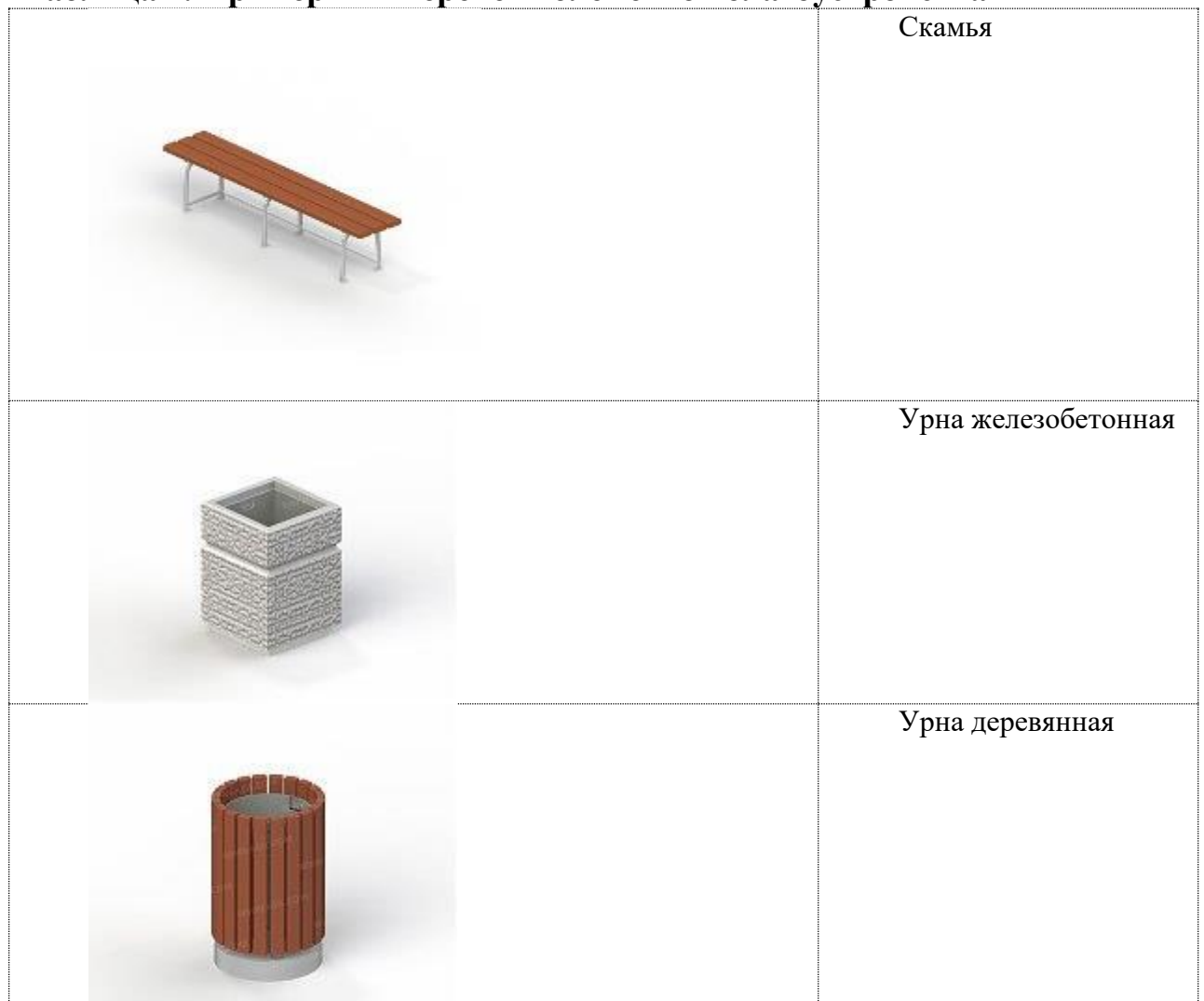
Таблица 2. Примерный перечень элементов благоустройства

Дополнительный перечень видов работ по благоустройству дворовых территорий: